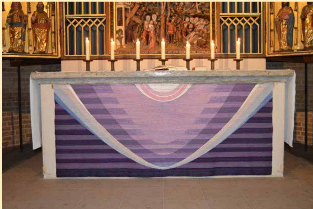
Das violette Antependium (von lat. ante „vor“ und pendere „hängen“) im Ratzeburger Dom.

Der Verzicht und das Fasten in dieser Zeit vor Ostern sollen auf einen bewussten Umgang mit Gottes Gaben und seiner Schöpfung hinweisen. Du kennst sicher auch die Erfahrung, dass man den Wert mancher Dinge erst richtig schätzen kann, wenn man sie eine Zeit lang nicht hatte! Seit einigen Jahren gibt es die Aktion „7 Wochen ohne“. Dieses „ohne“ kann jeder für sich selbst entscheiden. Zum Beispiel ohne Schokolade, ohne Handyspiele oder ohne Streit anzufangen. Hast du schon einmal bewusst auf etwas für Wochen verzichtet? Als Zeit der Besinnung soll die Fastenzeit uns aufzeigen, wie wir unser Leben verantwortungsvoll gestalten können. Die kirchliche Farbe der Passionszeit ist Violett. Sie ist eine königliche Farbe und soll die Vorbereitung auf einen König bedeuten. Violett steht außerdem für Buße und die Vorbereitung auf ein hohes Christusfest. Violett sind im Laufe des Kirchenjahres die Adventszeit, die Passionszeit und der Buß- und Betttag.