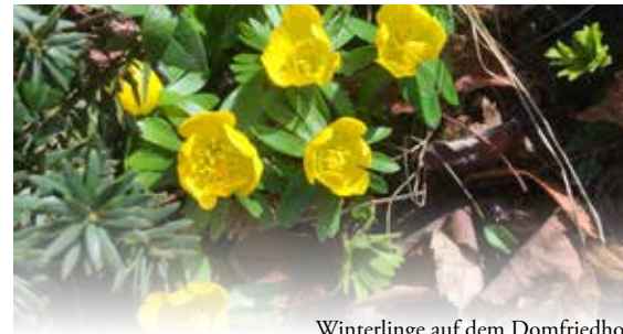
Winterlinge auf dem Domfriedhof

Treffpunkt Kupfermühlental: in der Nähe des Hauses Am Hang 9, 23909 Bäk – Bäcker Badestelle: Nähe Adresse Papengang 1, 23909 Bäk